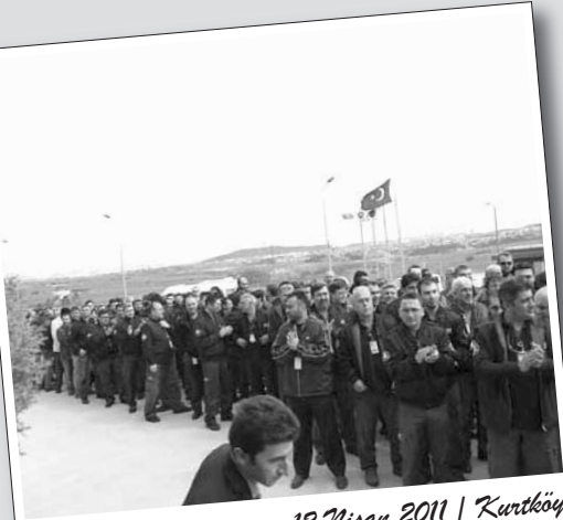
12 Nisan 2011 | Kurtköy

30 Mart günü fabrikaya grev kararı asılırken, patron da 7 Nisan günü lokavt ilan etti. Sandoz'da TİS süreci 10 Aralık 2010 tarihinde başlamıştı. Petrol-İş İstanbul 1 Nolu Şube'de örgütlü olan Sandoz işçileri mücadelede kararlı olduklarını ifade ediyorlar.