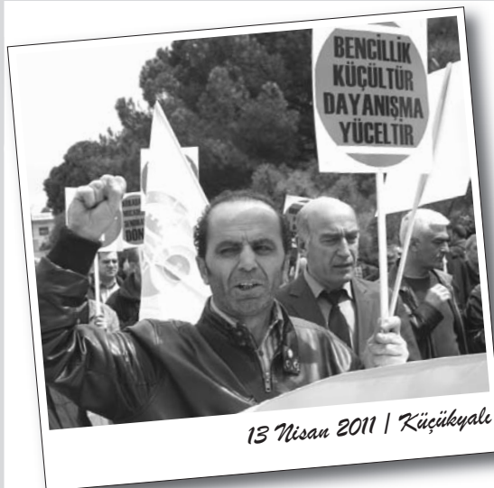
13 Nisan 2011 | Küçükyalı

Karayollarında peşkeşe ve sürgün politikalarına karşı Yapı-Yol Sen ve Yol-İş Sendikası 13 Nisan günü Maltepe'deki Karayolları 1. Bölge Müdürlüğü'nde ortak eylem gerçekleştirdi. Küçükyalı'daki Bölge Müdürlüğü içerisinde toplanarak giriş kapısına